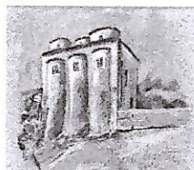
chiesa di San Marco (metà dell'XI secolo)

UNIONE EUROPEA Fondo europeo di sviluppo regionale